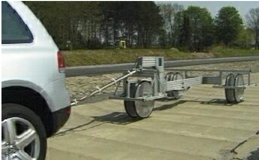
3-D Messanhänger im Einsatz